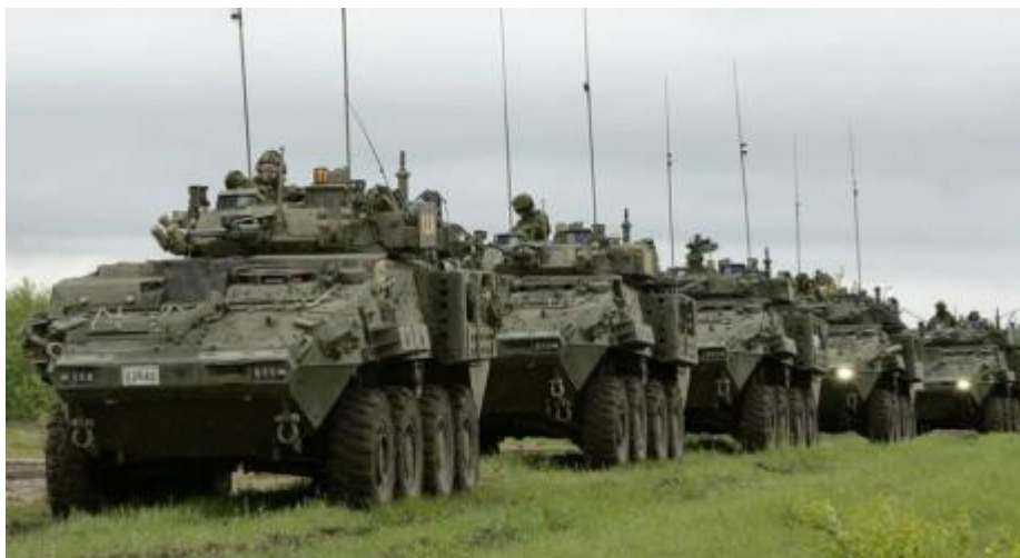
Бронетранспортери LAV Bison армії Канади

31. Україна разом з ЄС працює над сьомим пакетом санкцій щодо Росії, – Кулеба // День. URL: https://day.kyiv.ua/uk/news/020722-ukrayina-razom-z-yes-pracyuye-nad-somym-paketom-sankciy-shchodo-rosiyi-kuleba (02.07.2022 р.).