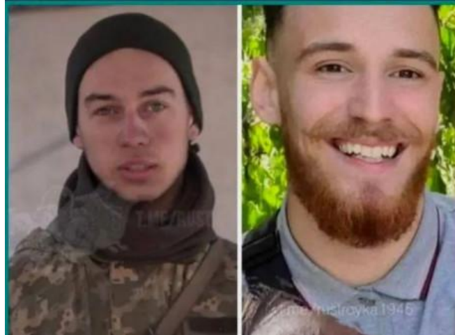
Ліворуч "Фокс", праворуч "Фрост"

192. Посол США Бріджит Брінк відвідала Макарів на Київщині // День. URL: https://day.kyiv.ua/uk/news/100722-posol-ssha-bridzhyt-brink-vidvidala-makariv-na-kyivshchyni (10.07.2022 р.).